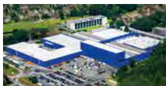
Hörmann KG Amshausen, Tyskland