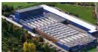
Hörmann KG Freisen, Tyskland