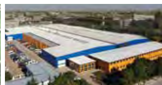
Hörmann Beijing, Kina