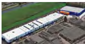
Hörmann Alkmaar B.V., Nederland