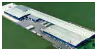
Hörmann LLC, Montgomery IL, USA