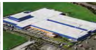
Hörmann KG Ichttershausen, Tyskland