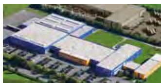
Hörmann KG Antriebstechnik, Tyskland