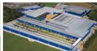
Hörmann KG Brockhagen, Tyskland