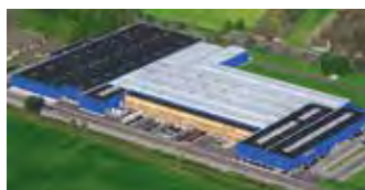
Hörmann KG Werne, Tyskland