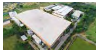
Shakti Hörmann Pvt. Ltd., India

Som eneste produsent på det internasjonale markedet tilbyr Hörmann-gruppen alle porter, dører, vinduer og andre produkter komplett fra egen produksjon. Produktene fremstilles ved høyt spesialiserte fabrikker med den nyeste teknologi. Gjennom et omfattende salgs- og servicenett i Europa og med tilstedeværelse i USA og Asia er Hörmann en sterk internasjonal partner. Med kompromissløs kvalitet.