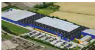
Hörmann KG Brandis, Tyskland