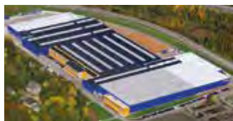
Hörmann KG Eckelhausen, Tyskland