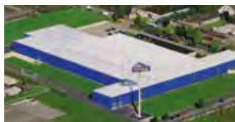
Hörmann KG Dissen, Tyskland