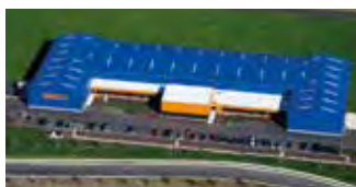
Hörmann Flexon LLC, Burgettstown PA, USA