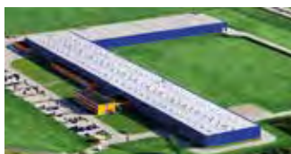
Hörmann Legnica Sp. z o.o., Polen