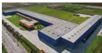
Hörmann Tianjin, Kina